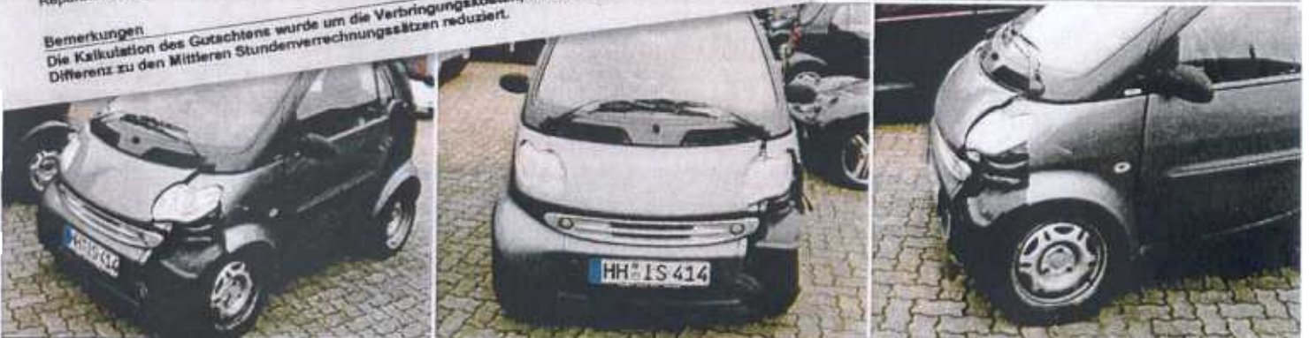
UNFALLWAGEN Der graue Smart ist sichtbar beschädigt. Diese Fotos legte der vom Unfallopfer beauftragte freie Sachverständige seinem unabhängigen