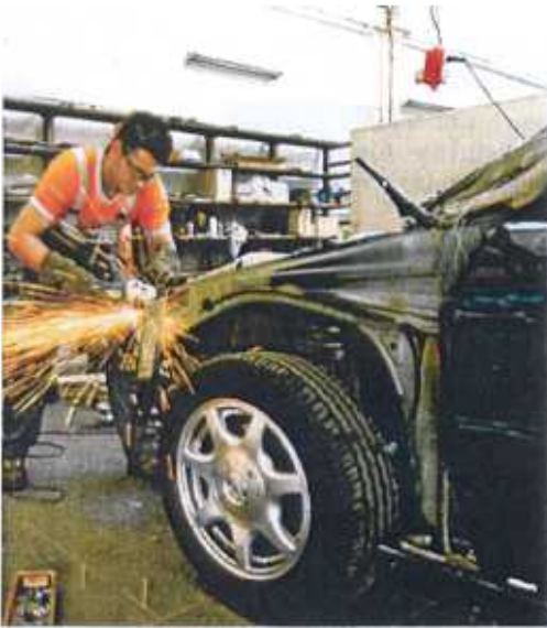
ersicherer müssen für Karosserieschäden bezahlen